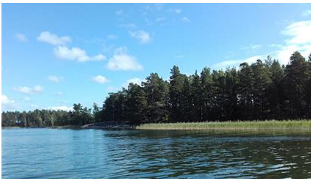
Bild 5. Kvarter 1 fortsätter från tidigare bild ända till den nordliga spetsen på Lövholmen till vänster.