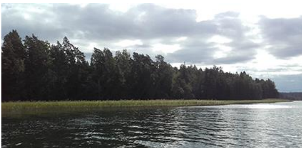
Bild 6. Den västra delen av Lövholmen som förblir obebyggd (mitten på bilden).