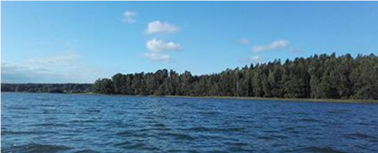
Bild 1. Lövholmens södra halva mot öster. Tomten i kvarter 2 ligger i mitten av bilden.