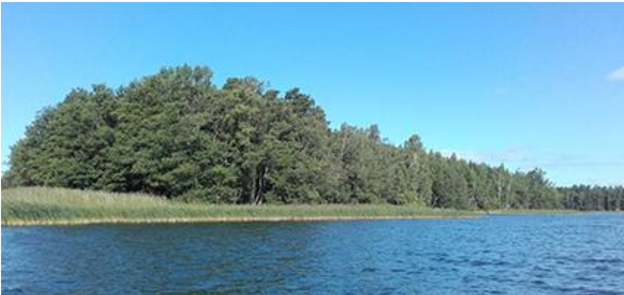
Bild 3. Dens södra udden av Lövholmen förblir obebyggd.