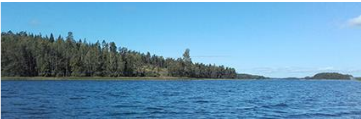
Bild 2. Mitten av Lövholmen mot öster, detta strandparti förblir obebyggt.