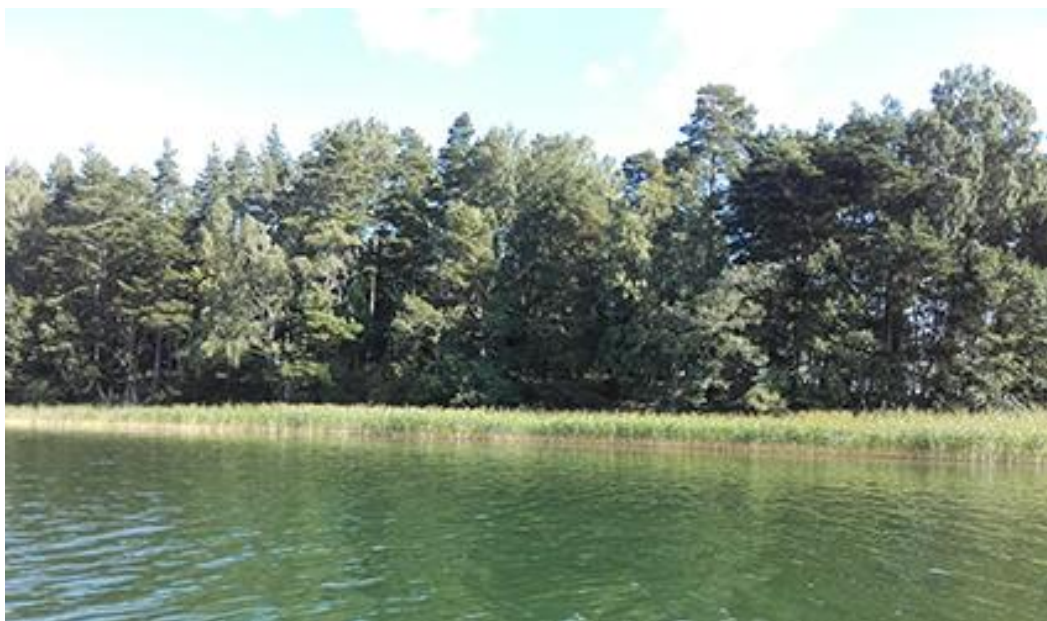
Bild 4. Lövholmens västra strand. Halva bilden till vänster utgör tomt 2 i kvarter 1. Vassen växer från ca 2 meters djup, vilket av bilderna på denna sida ger en uppfattning om stranddjupet.