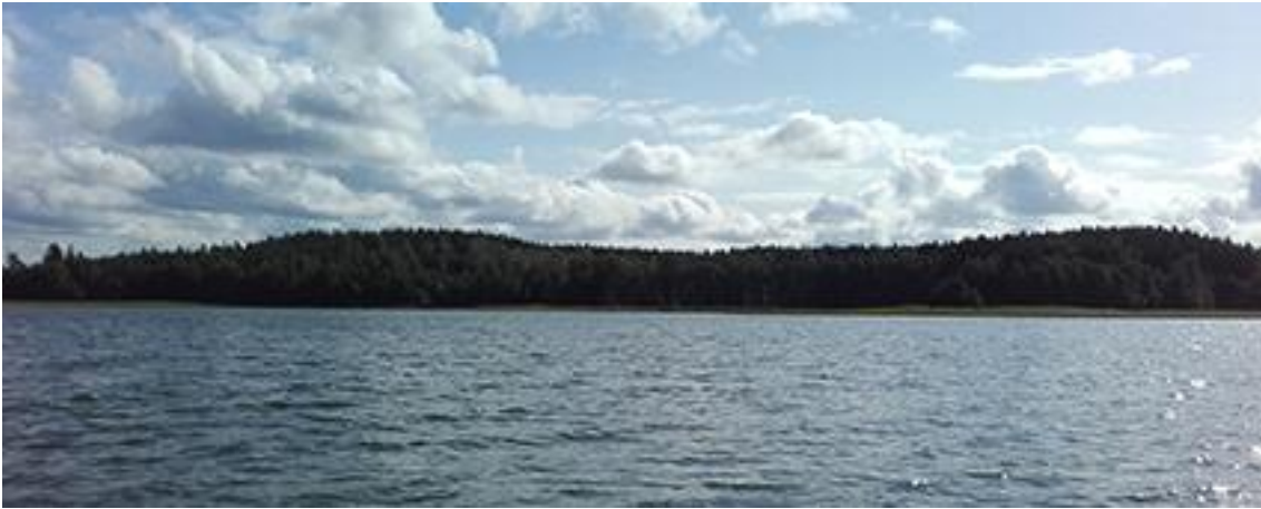
Bild 7. Hela fastlandsstranden av planområdet ryms på denna bild. Trädbeståndet når ända till strand. Stranden utanför udden vid Mönäs till höger är kraftigt vassbevuxen.