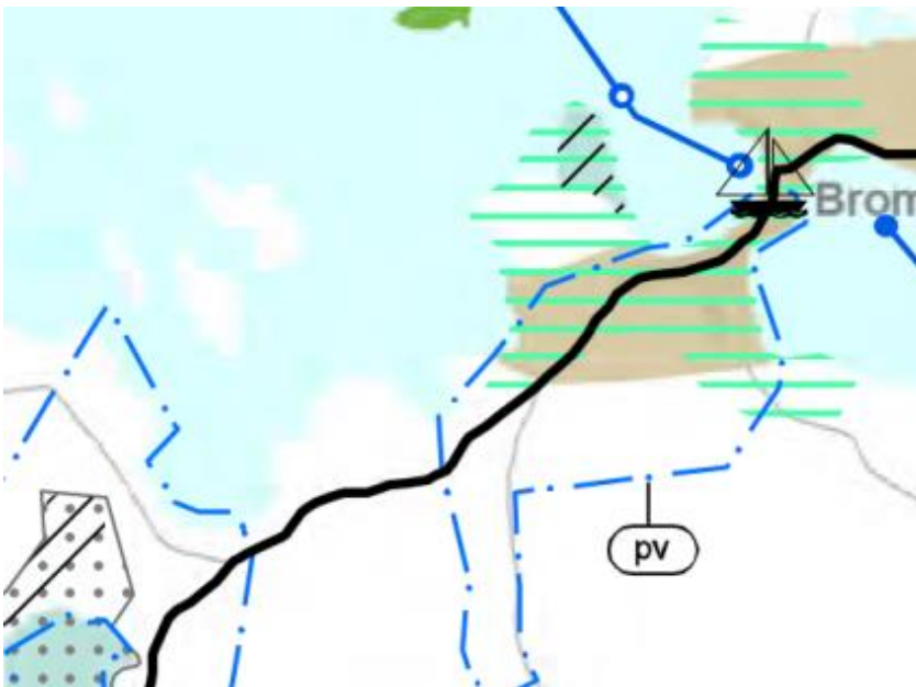
Utdrag ur landskapsplanen.

I och med avsaknad av generalplan är det landskapsplanen som i främsta rummet styr uppgörandet av stranddetaljplan.