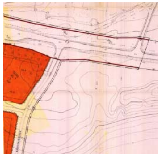
Bild 3. Utdrag ur gällande detaljplan.