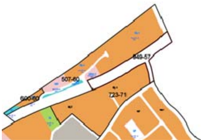
Bild 2. Utdrag ur tidsenligt planindex