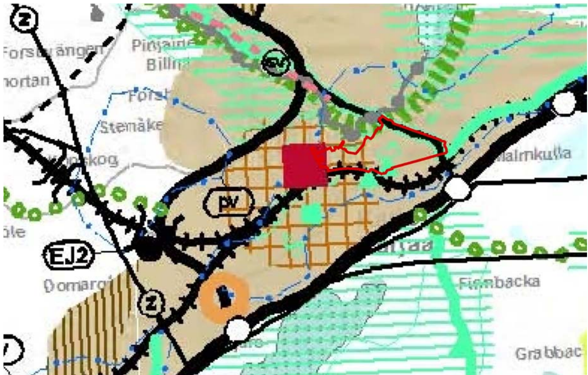
Bild 2. Utdrag ur landskapsplanssammanställning för Nyland. Planeringsområdet avgränsat med röd färg.