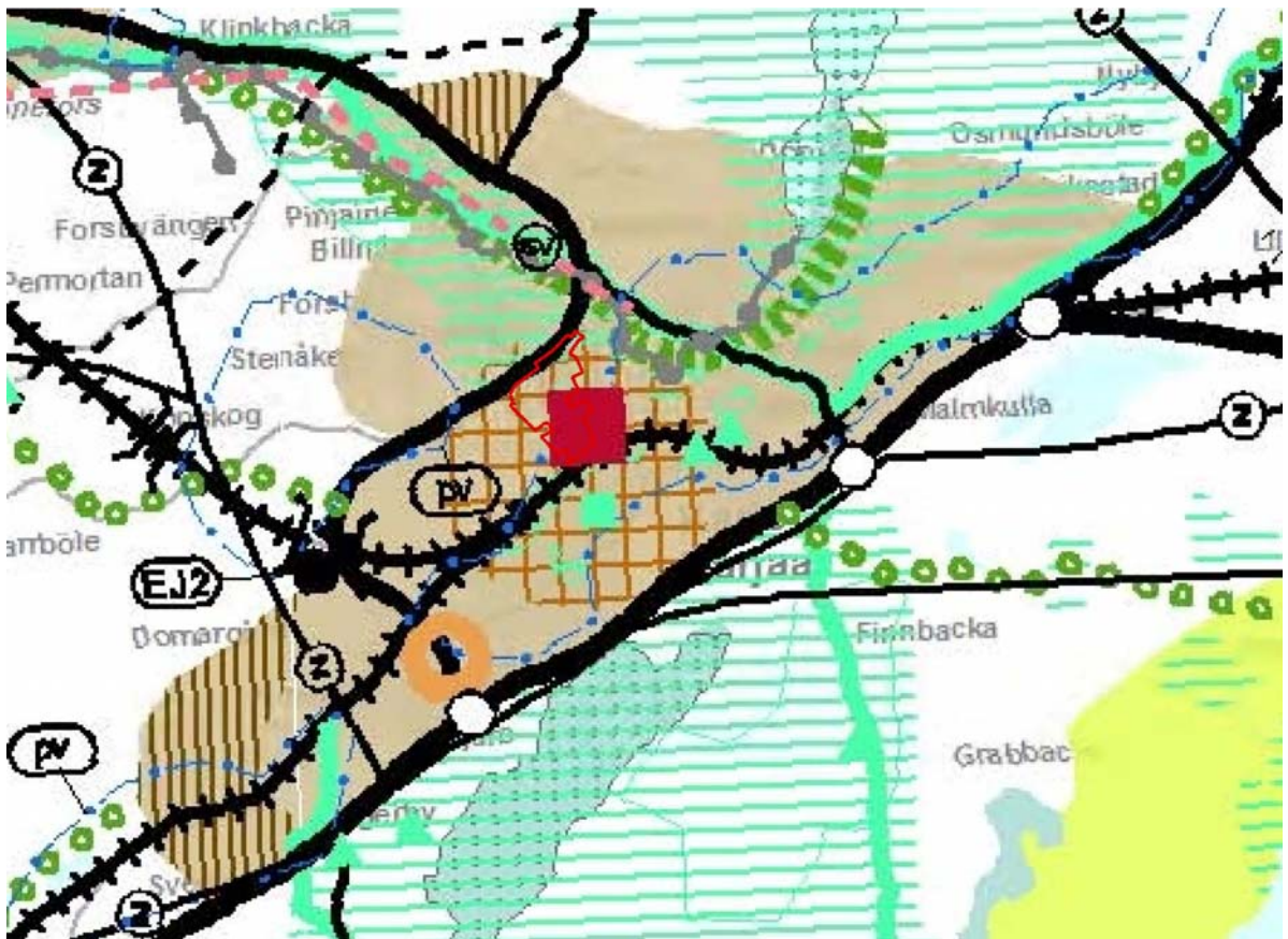
Bild 1. Utdrag ur landskapsplanssammanställning för Nyland. Planeringsområdet avgränsat med röd färg.

Beteckningen för centrumfunktioner har i etapplandskapsplanen 2 upphävts och ersatts av en ny beteckning för centrumfunktioner som möjliggör placeringen av totalt 30 000 v-m2 stornheter av detaljhandel på Karis centrumområde. Beteckningen för ett område som ska förtätas har lagts till i etapplandskapsplanen gällande Karis centrumområde. Planområdet ligger i sin helhet på detta område. Beteckningen för ett område som ska förtätas anvisas för en tätort som stöder sig på hållbart trafiksystem. Området ska utvecklas effektivare än andra områden på tätorten och så att den stöds av kollektivtrafik, gång- och cykeltrafik.