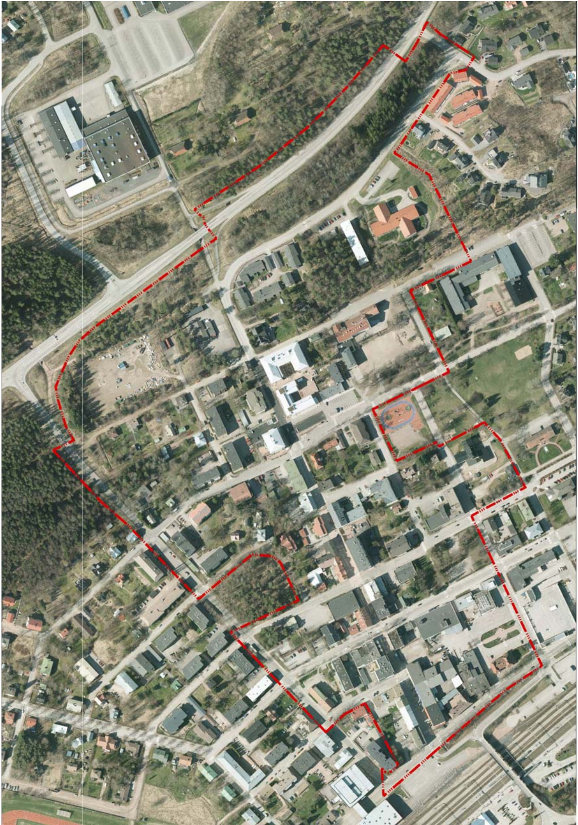
Bild 1. Området från luften. Planområdet märkt med en röd linje.