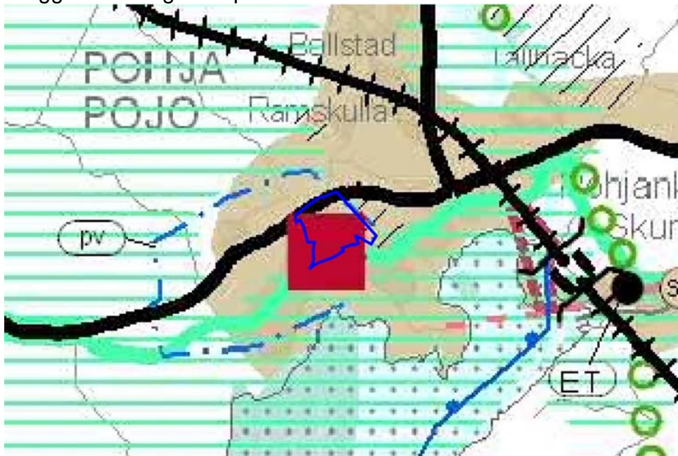
Bild 1. Utdrag ur landskapsplan för Nyland. Planeringsområdet avgränsat med blå färg.

I den andra etapplandskapsplanen som godkänts i landskapsfullmäktige i mars 2013 och som väntar på fastställande av miljöministeriet har man inte definierat några tilläggsmarkeringar för planområdet.