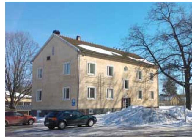
De byggnader från 1940-talet som använts som internat byggs igen om till bostäder.

Parkeringsplatserna ska avgränsas från vistelseområdena med t.ex. planteringar.