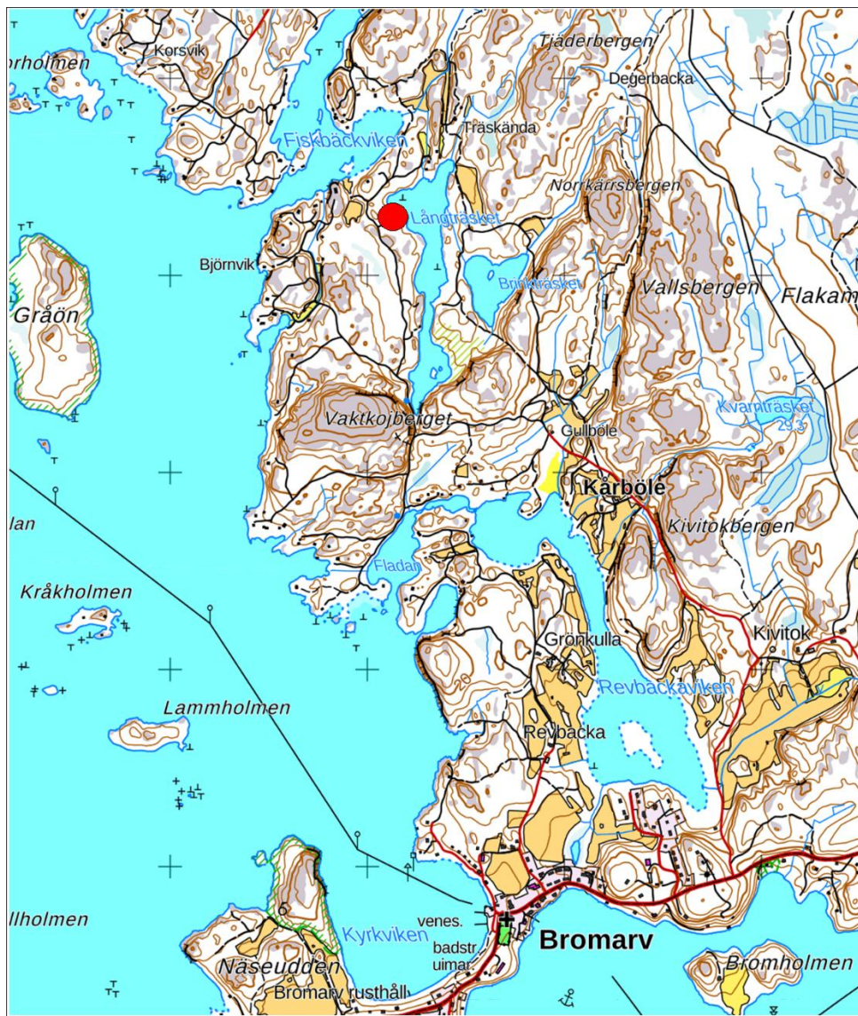
Bild 1. Planområdet ligger norr om Bromarv kyrkby på Långträskets västra strand.