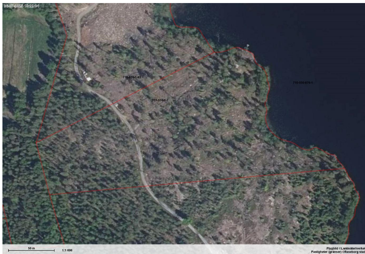
Bild 4. Lantmäteriets flygtoto över Kilen 710-550-1-7.