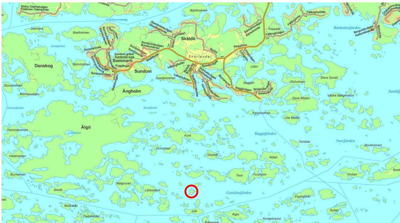
Bild 1. Planområdets läge i rött