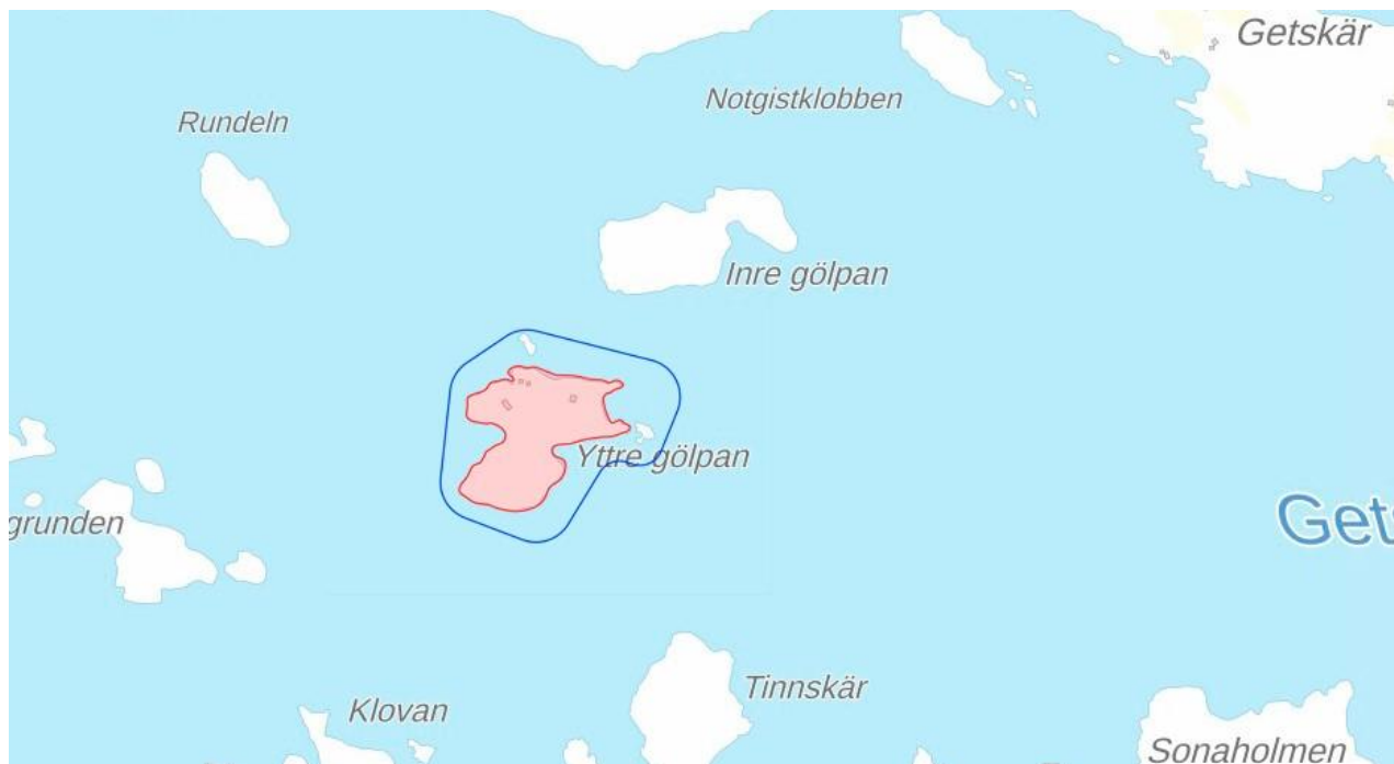
Bild 2. Planområde med röd och influensområde med blå linje