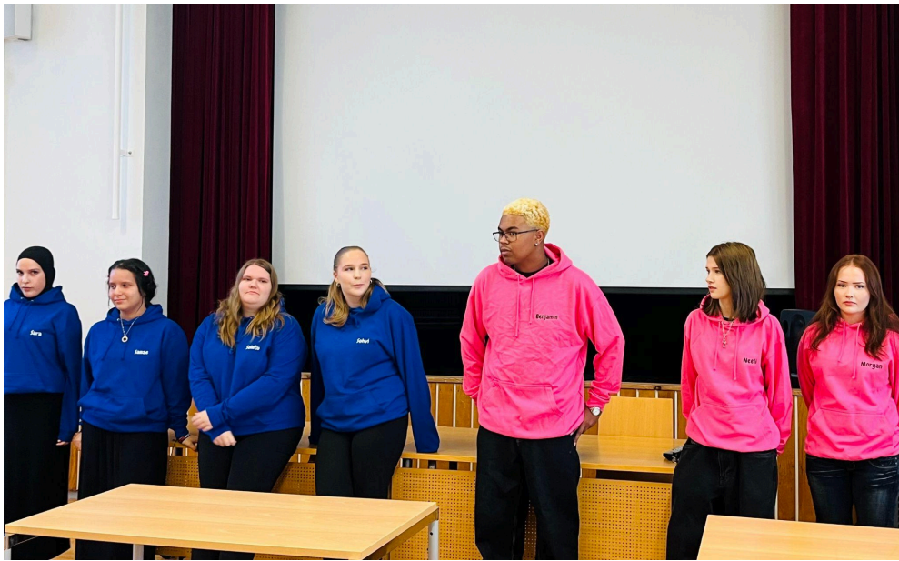
Karjaan lukion tutoreita ja hyvinvointitutoreita.