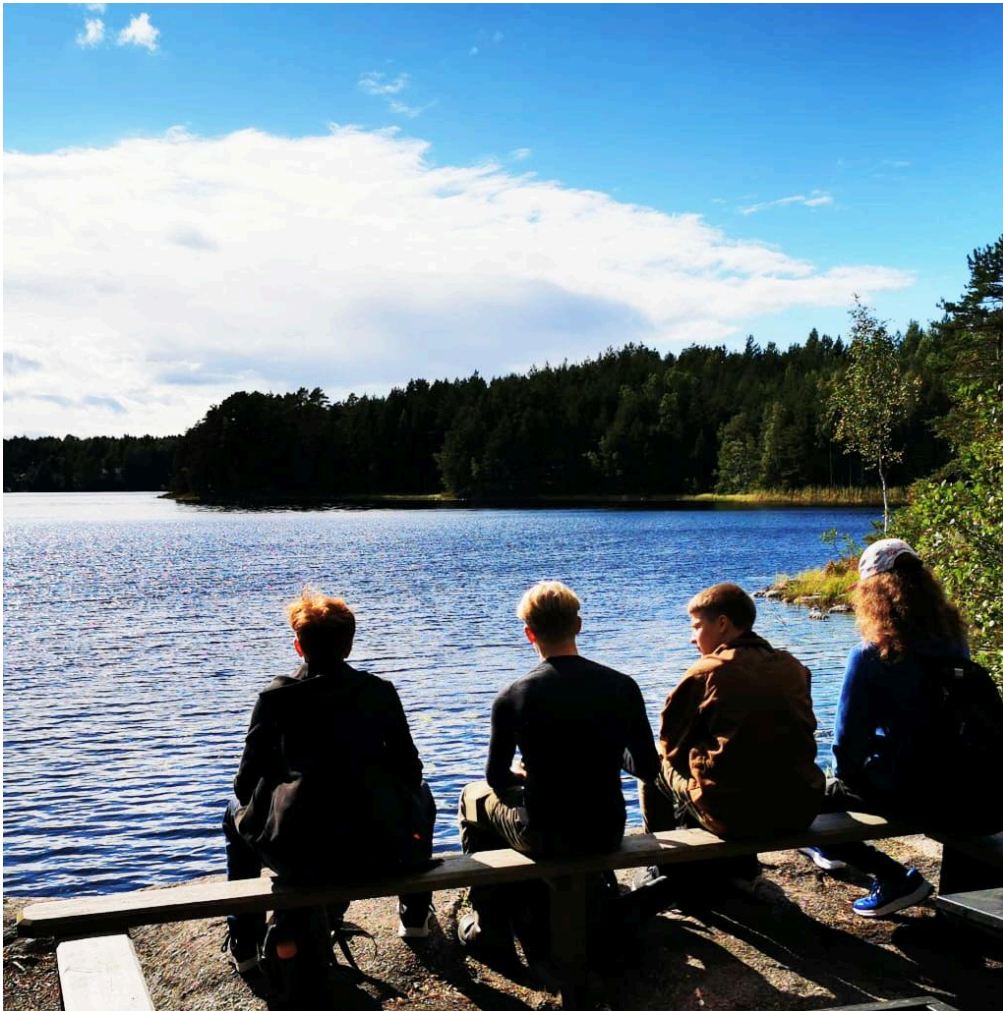
Lukiolaisia Teijon kansallispuistossa elokuussa 2025 liikunnan opintojaksolla.