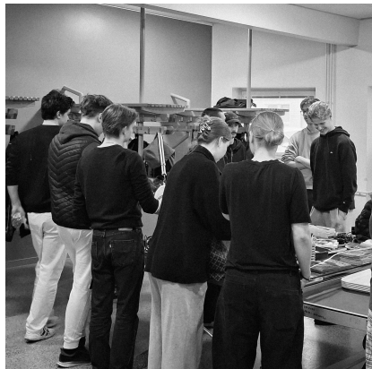
Eväiden pakkaamista ennen ylioppilaskoetta.