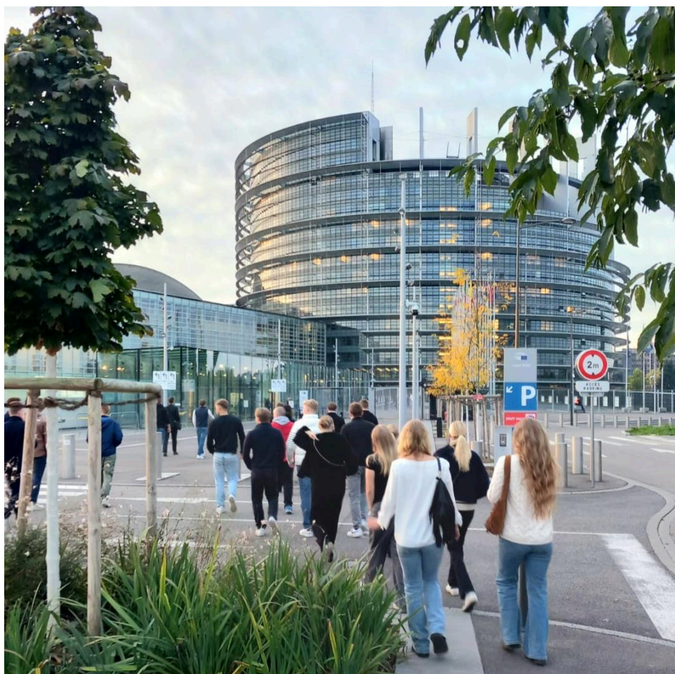
Euroscola-matkalaiset viettivät päivän europarlamentissa lokakuussa 2025.

Pitkään jatkunut Ambassador School -toiminta huipentui tänä lukuvuonna Euroscola-tapahtumaan. Se on ainutlaatuinen kokemus, jossa nuoret pääsevät näkemään eurooppalaista päätöksentekoa sisältä päin. Matkalle Strasbourgiin ja Euroopan parlamenttiin osallistui yhdeksän nuorta – kaikki heistä lakitetaan tänään myöhemmin tässä juhlassa.