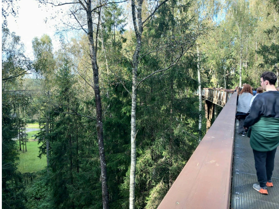
Nordplus Junior -projektin osallistujat kulkivat latvojen tasalla Liettuassa lokakuussa 2025.

28–3.10. 6 opiskelijaa ja 2 opettajaa Liettuassa Nordplus Junior -projektimatalla