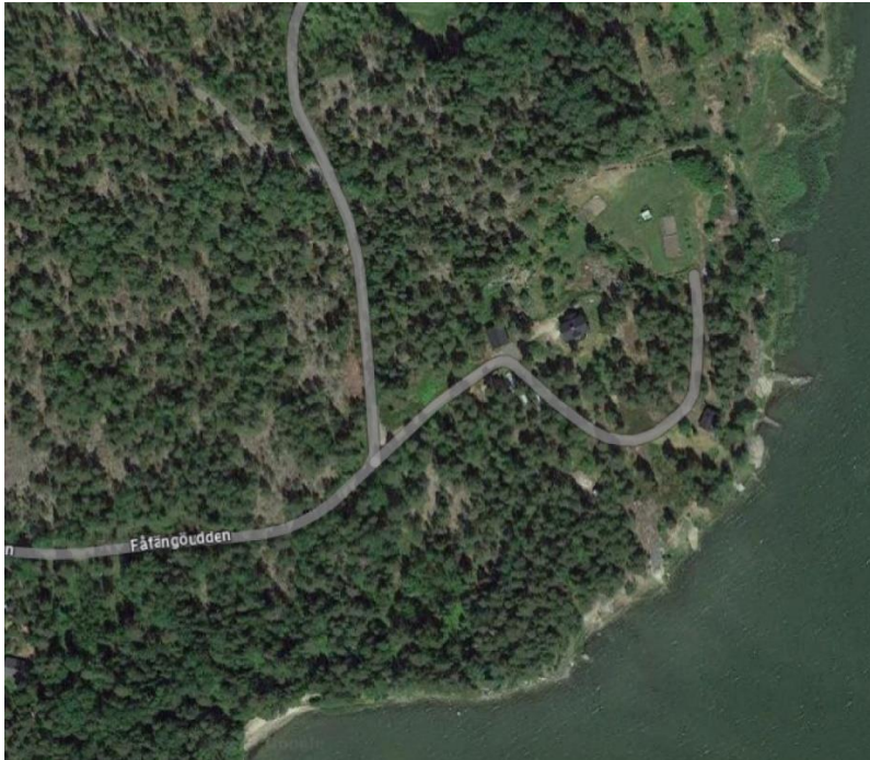
Bild 3. Lantmäteriverkets flygbild finns på pärmen. Bilden ovan är Googles satellit bild.