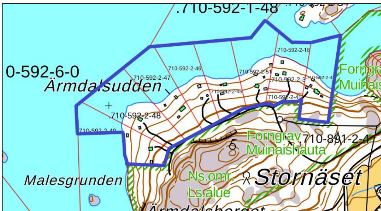
Bild 2. Planområdets gräns på terrängkartan (LMV) Kuva 2. Kaava-alueen rajaus maastokartalla (MML).

Suunnittelualue koostuu kahdeksasta rakentuneesta vapaa-ajan asunnon rakennuspaikasta.