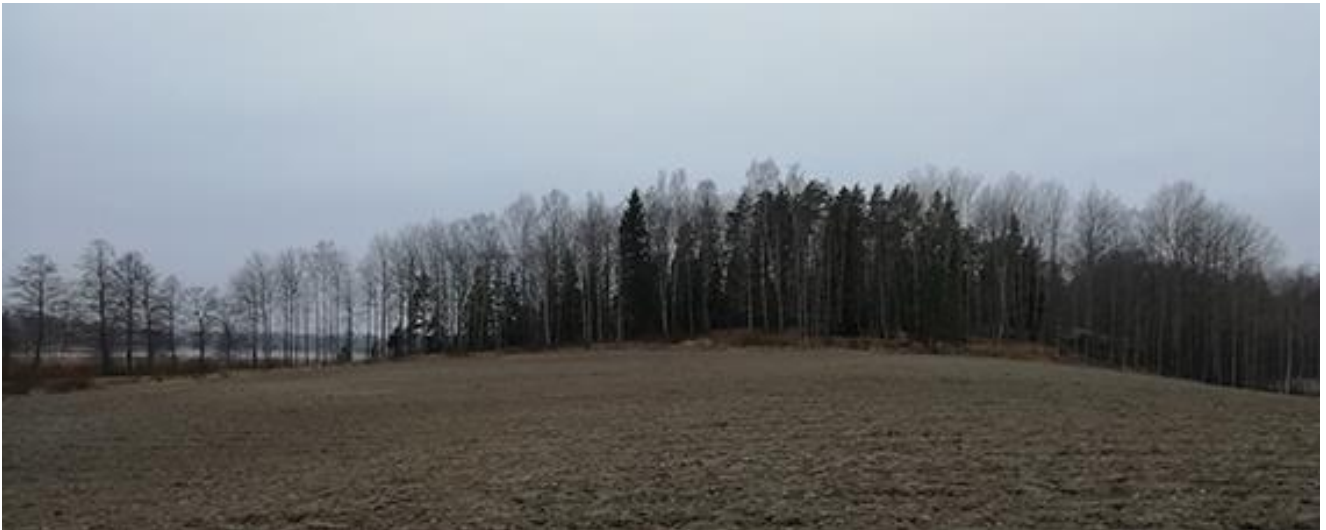
Kuva 5. Maisemakuva Orrkullenista. Kortteli sijoittuu kuvan keskellä olevasta isosta kuusesta vasempaan pellonreunaan.