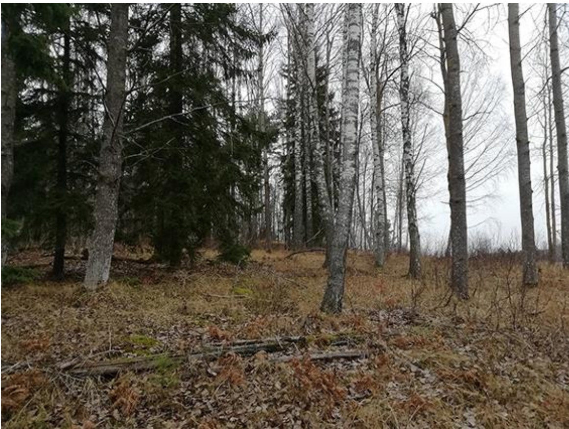
Kuva 1. Kaava-alueen kohta, johon kortteli sijoittuu.