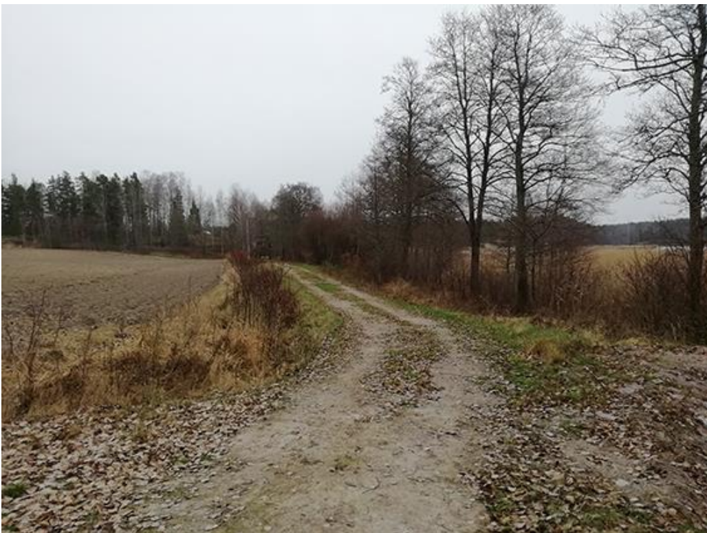
Kuva 3. Alueelle on valmis tie.

Alue on rakentamaton. Alueelle kulkee kuitenkin valmis tie rantaan asti. Suunnitellun korttelin alueen metsä on harvennettu.