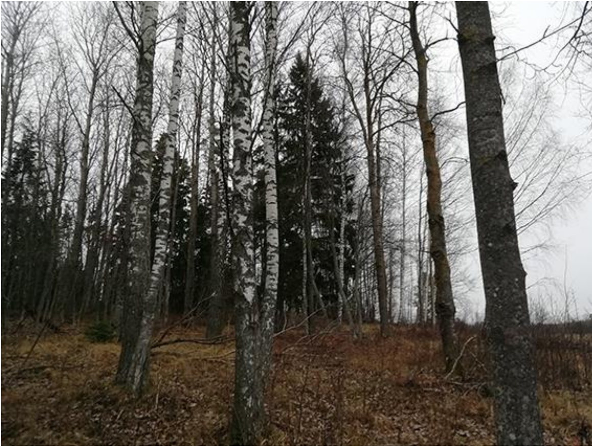
Kuva 2. Lomarakennuksen paikka on suoraan keskellä olevasta isosta kuusesta kuvaajan suuntaan.