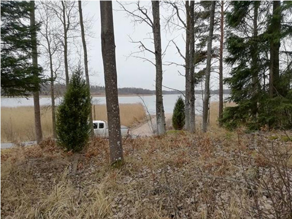
Kuva 4. Alueen yhteys rantaan on rakennettu valmiiksi.